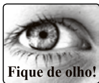
Fique de olho!

Assim sendo, neste ano as mensalidades do plano, sofreram um reajuste a maior no percentual de 2,07% (dois vírgula sete por cento) para garantir a sobrevivência do plano e manter a qualidade na prestação dos serviços médicos, que caracteriza a razão de ser do Plano de Saúde Assufemg.