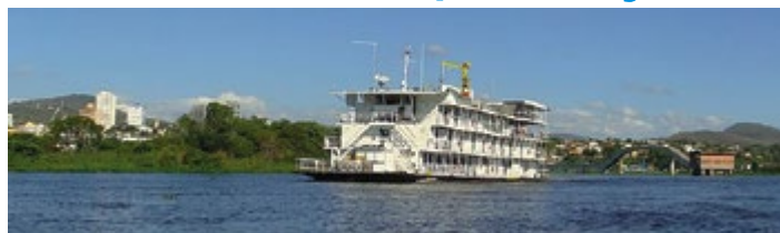
O barco Calipso é conhecido como “Pérola do Pantanal”

A Assufemg está organizando através da Banzai Turismo oito vagas no pacote turístico para pescaria no Pantanal Matogrossense, ano de 2013. As vagas destinadas à Assufemg são oferecidas juntamente com o grupo Caçadores de Piranha que já realizou este passeio por seis anos consecutivos.