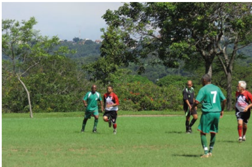
I Encontro reuniu grandes atletas da velha guarda em 2012.

Dentro das comemorações dos 39 anos da Assufemg e da 28ª edição do Rosas de Abril o Encontro Máster tem como objetivo resgatar grandes