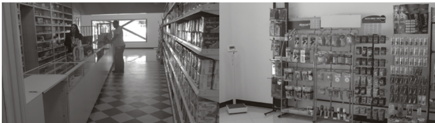
Drogaria Assufemg: ampliação do espaço traz mais conforto e comodidade, assim como maior diversidade de marcas e produtos.

Importante: os produtos comercializados na drogaria são todos os permitidos pela Anvisa, conforme disposto no art. 55 da Lei 5991, de 17/12/1973. São eles: medicamentos, correlatos, cosméticos, produtos de higiene pessoal, perfumes.