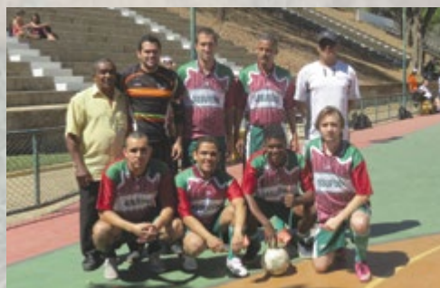
Equipe de Futsal da Assufemg

Na oportunidade, convida todos a participarem da Semana do Servidor de 2013, que por sinal, já teve início com a disputa do Torneio de Futsal , com partidas realizadas sempre aos sábados, no Centro Esportivo Universitário - CEU (ler matéria na página 4).