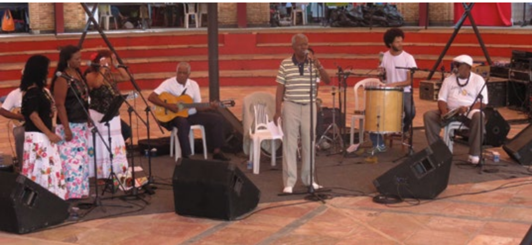
Mestre Conga apresentou o espetáculo Decantando em Sambas

As apresentações do Grupo Ânima dia 16/04 e do trio instrumental Chinese Cookie Poets, no dia 23/04 encerram a programação do mês de abril de 2014, do Projeto Quarta Doze e Trinta . Durante todo o mês, todos os shows do Projeto fazem parte da programação dos eventos comemorativos do XXIX Rosas de Abril - aniversário de 40 anos da Associação dos Servidores da UFMG-Assufemg. O Doze e Trinta é uma promoção da Diretoria de Ação Cultural (DAC) e da Coordenadoria de Assuntos Comunitários (CAC).