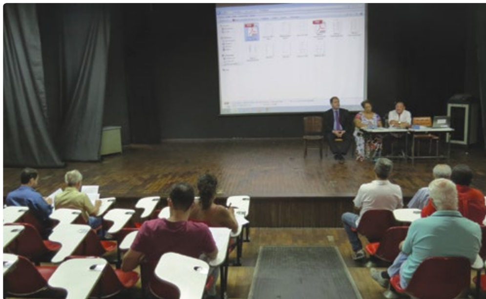
Assembleia Estatutária da Assufemg foi realizada no auditório da Escola de Belas Artes

A Assembleia Estatutária (AE) da Associação dos Servidores da Universidade Federal de Minas Gerais - ASSUFEMG, convocada antecipadamente conforme determina seu Estatuto, foi realizada no dia 10 de dezembro de 2014, no Auditório da Escola de Belas Artes da UFMG, Campus Pampulha quando, constatado o quórum necessário para a instalação da mesma, deliberou-se sobre a aprovação da prestação de contas referentes aos exercícios dos anos de 2012 e 2013, que foi aprovada por unanimidade, pelos presentes.