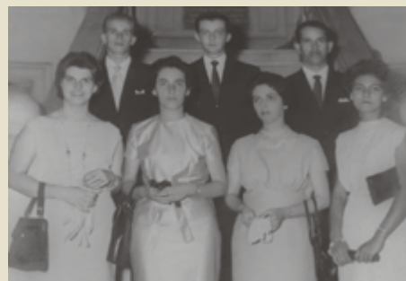
Formatura (1965), na Escola de Música (UFMG)

Em 1965 formou-se músico (Clarinete) pela UFMG, da qual tornou-se mestre, em 1975, desligando-se compulsoriamente em