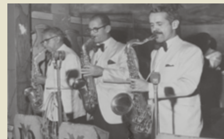
Na década de 1970, no Montanhez Dancing.