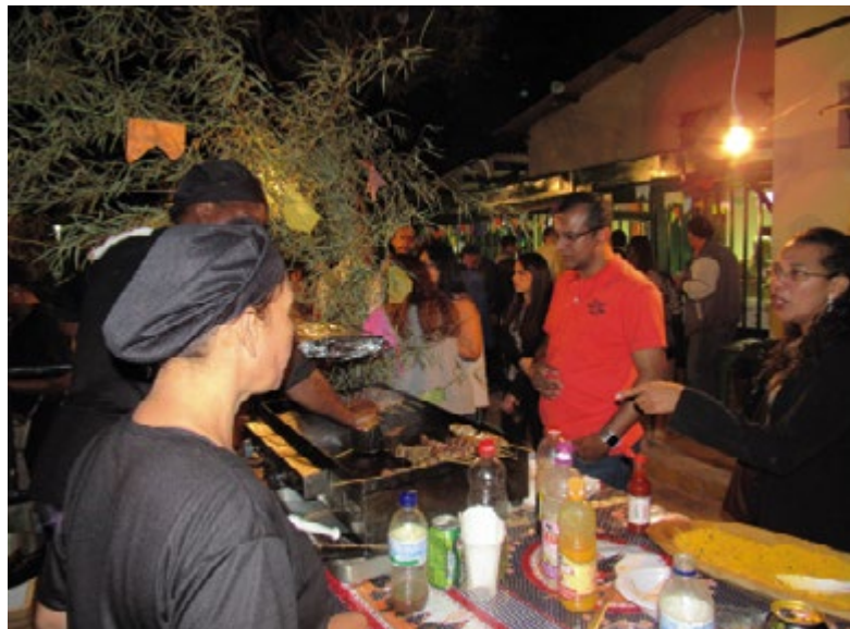
Barraquinhas de comidas típicas