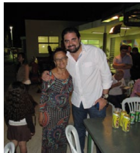
...alegria e confraternização.