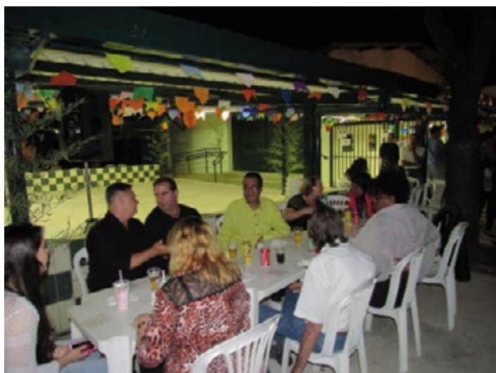
...trouxe novamente ao campus universitário,...