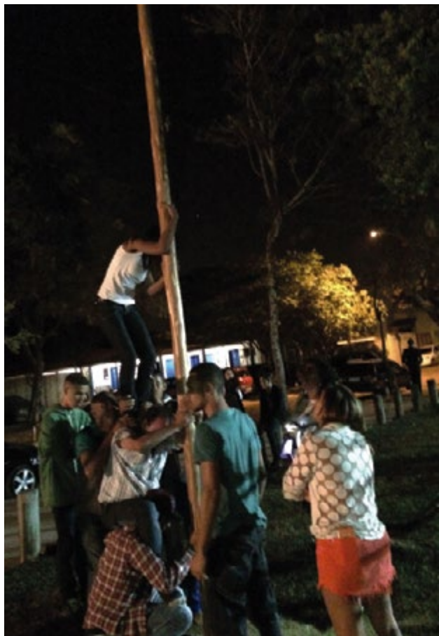
Pau de Sebo, coragem e destreza

Com a presença de cerca de 800 pessoas, tudo transcorreu em clima de harmonia e confraternização. Num momento em que os TAEs reivindicam melhores condições de trabalho, o tradicional evento promovido pela Assufemg, serviu para trazer um pouco de alegria, relaxamento e entretenimento, aos presentes.