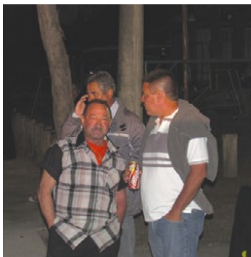
...com muito arrastá pé no salão, conversa boa...