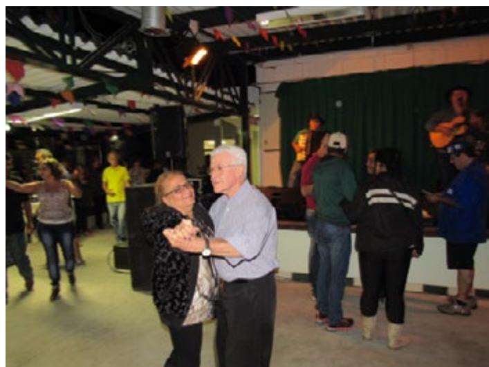
...o tradicional forró Agostino,...