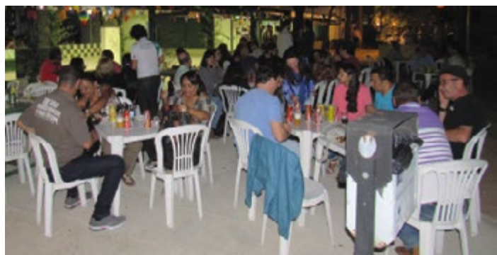
O tradicional Bingo conferiu a sorte e a alegria dos ganhadores.