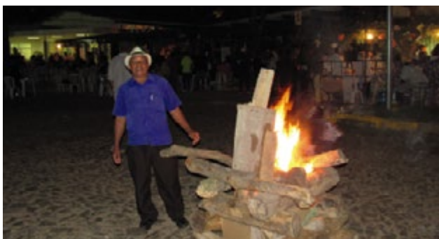
A fogueira está queimando... em homenagem a São João!