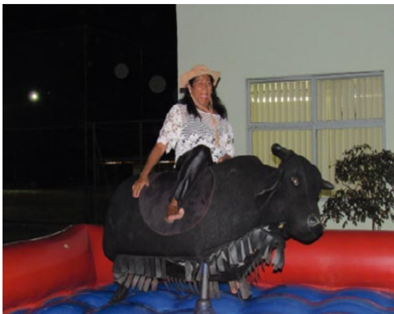
Na brincadeira do Touro Mecânico , uma proposta ousada, para se ter a coragem e valentia de um toureiro.