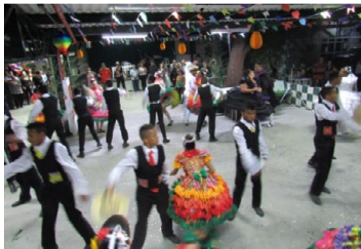
Sangê de Minas trouxe folia e diversão