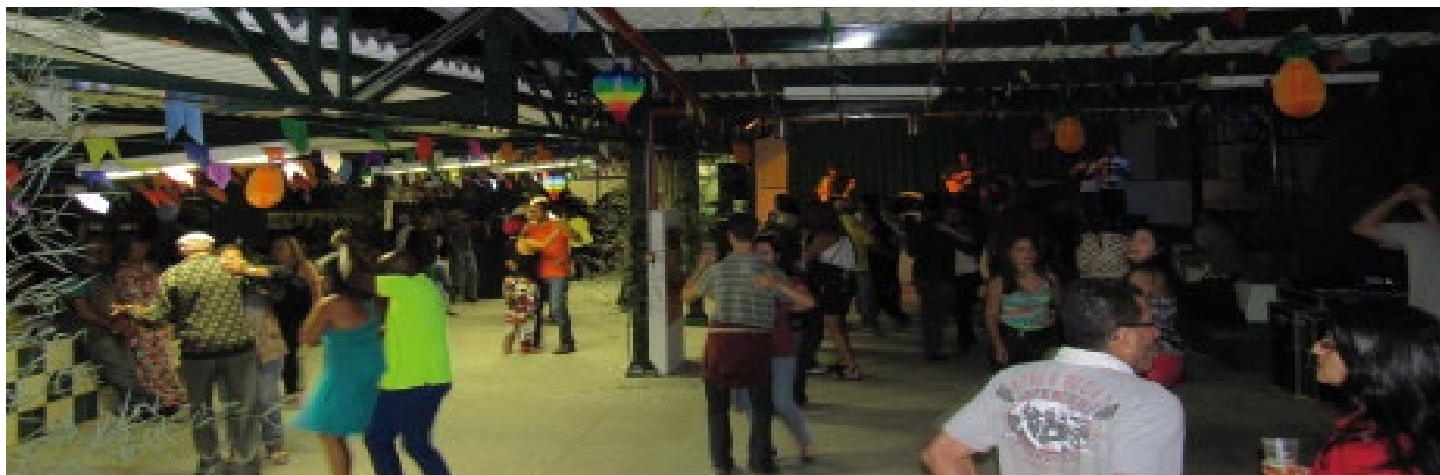
A décima primeira edição do “Arraiá” da Assufemg...

O Forró é uma festa popular brasileira, de origem nordestina, que acontece em Junho, Junina. Com a idéia de ser a última da temporada, a Assufemg promove a Festa Agostina . Este ano, a decoração colorida do Espaço Cultural Francisco Assis Motta, com bandeirolas alegrou o ambiente. Barraquinhas de comidas típicas, o touro mecânico, o pau de sebo e a fogueira de São João tornaram o espaço aconchegante e alegre. Uma oportunidade não apenas de dançar forró, mas de confraternização entre associados e amigos. Confira abaixo alguns flashes do XI Arraiá da Assufemg.